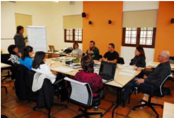
Grupo de trabajo sobre calidad en equipamientos para la educación ambiental.