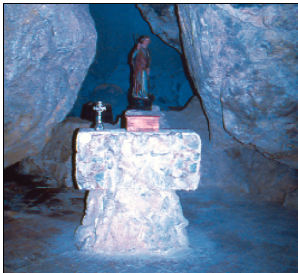
Markina, San Miguel de Aretxinaga

Desde Bolibar se asciende a la colegiata de Zenarruza , templo gótico del siglo XVI, por una calzada cuyos restos se conservan hoy en día. En el interior, destaca la capilla de las Angustias o del abad Yrusta, en la que el abad aparece representado como figura orante acompañado de Santiago peregrino. Su claustro renacentista es único.