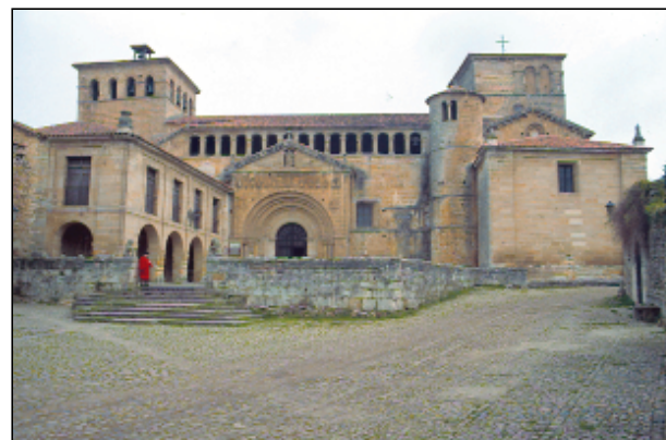
Santillana del Mar, Colegiata

Al recorrer SANTILLANA DEL MAR nos parecerá haber retrocedido en el tiempo. Con sus magníficos palacios, casas nobles y calles empedradas, el conjunto de la colegiata de Santa Juliana , del siglo XII, cuyo campanil nos recuerda el de la Iglesia de San Martín de Frómista. Es de admirar su claustro románico con bellísimos y elaborados capiteles, hermoso Pantócrator, bajorrelieve románico de Sta. Juliana, su espléndido Retablo del altar mayor, realizado a principios de siglo XVI, el sarcófago de Dña. Fronilde, o su pila bautismal románica.