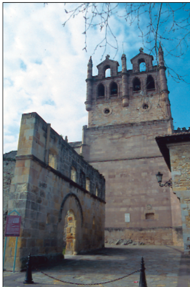
San Vicente de la Barquera, iglesia de Nuestra Señora de los Angeles y ruinas del Hospital de Peregrinos

charse hacia LOS CORRALES DE BUELNA y proseguir por ARENAS DE IGUÑA, BÁRCENA DE PIE DE CON- CHA, LANTUENEO, CAÑEDA, REINOSA, MATAMORO- SA, CERVATOS, FOMBELLIDA, MATAPORQUERA , y, desde aquí, adentrarnos en tierras de Palencia para, a través de Aguilar de Campoó, Herrera de Pisuerga y Osorno, llegar hasta Carrión de los Condes y enlazar así con el “Camino Francés”.