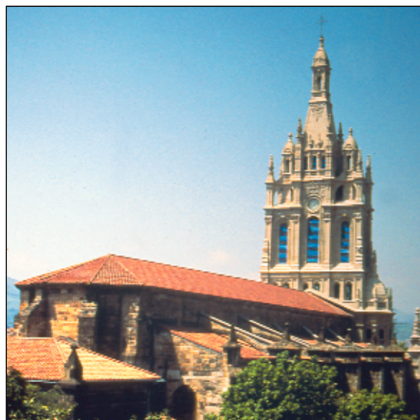
Bilbao, Nuestra Señora de Begona

BILBAO es una villa de gran prosperidad desde su fundación en el año 1300 por Don Diego Lope de Haro. Su tradición jacobea es importante. En la carta fundacional se designa la iglesia de Santiago como templo de la nueva villa y, posteriormente, en el año 1643, el papa Urbano VIII nombró al apóstol patrón de la ciudad. La catedral de Nuestro Señor Santiago (S. XV) es el templo gótico más monumental de los que existen en Vizcaya. La iglesia de San Antón , situada al lado del puente del mismo nombre, goza de gran popularidad. De estilo gótico, su portada es renacentista y la torre barroca.